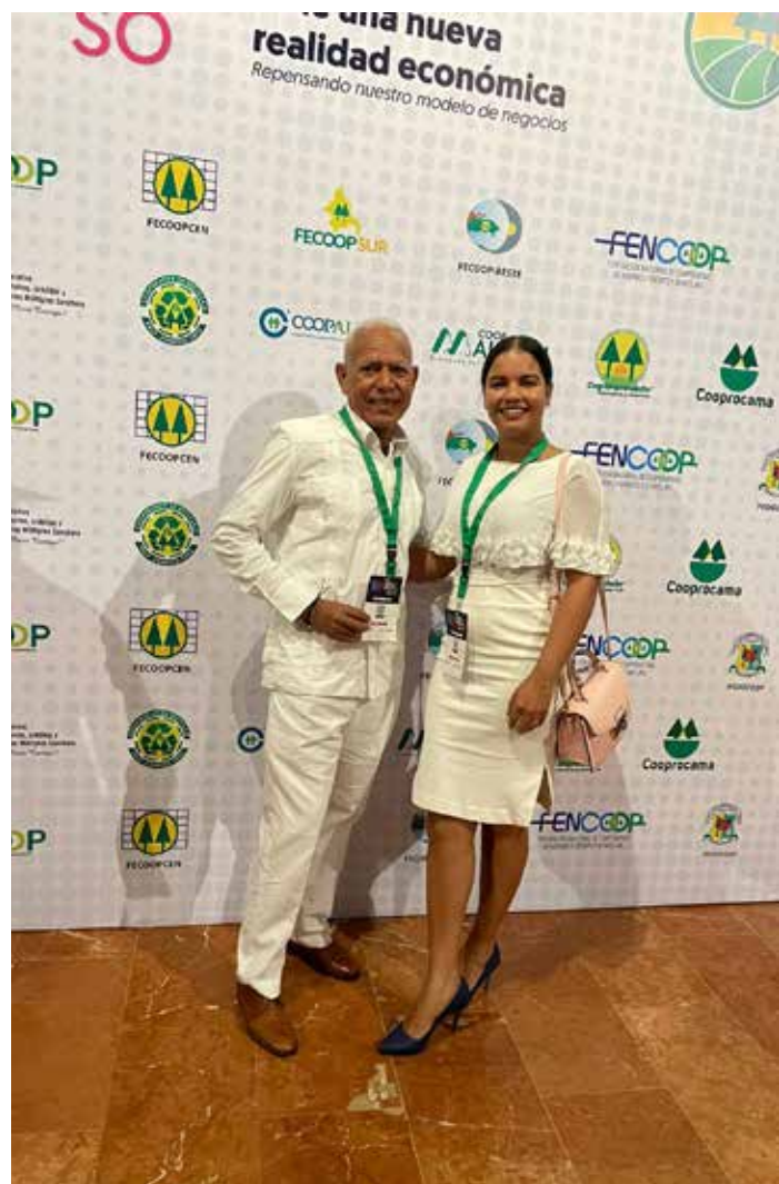
V Congreso de FECOOPNORDESTE

En septiembre se presentó un informe sobre el progreso de los grupos juveniles en las cooperativas COOPSANRAFAEL y COOPMAIMÓN. Se identificaron áreas de mejora y se propuso un plan de acción para fortalecer la participación juvenil en las cooperativas afiliadas que aún no forman parte de este proyecto.