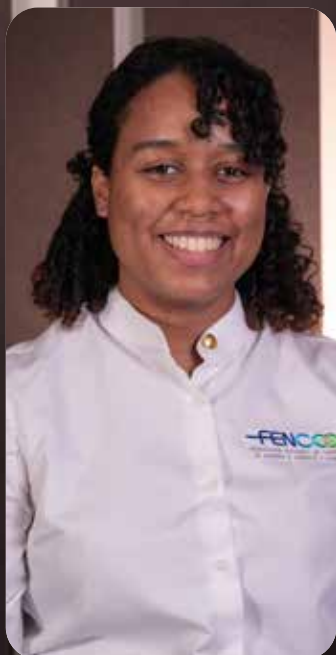
Maité Mercedes Audiovisuales